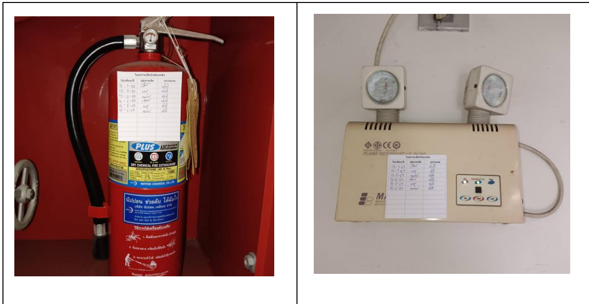
อุปกรณ์ป้องกันอัคคีภัย และอุปกรณ์แจ้งเหตุอัคคีภัย