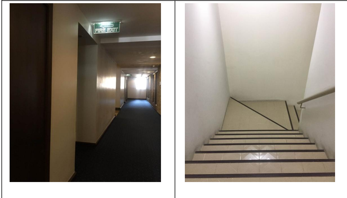
ป้ายบอกทางหนีไฟ ประตูหนีไฟ และบันไดหนีไฟ

รูปที่ 2.4.6-1 อุปกรณ์ป้องกันอัคคีภัย อุปกรณ์แจ้งเหตุอัคคีภัย ป้ายบอกทางหนีไฟ ประตูและบันไดหนีไฟ