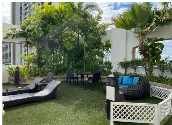
พื้นที่สีเขียวบนอาคาร

รูปที่ 2.5-1 สภาพพื้นที่สีเขียวบริเวณชั้นล่าง และพื้นที่สีเขียวบนอาคารโครงการ