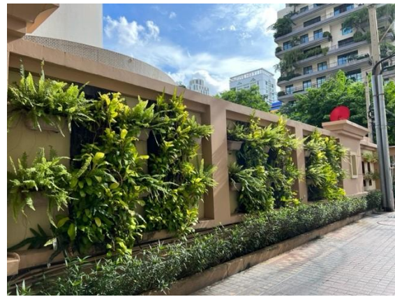
พื้นที่สีเขียวบริเวณชั้นล่าง